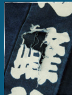
洗剤で洗ったために破れてしまった半天