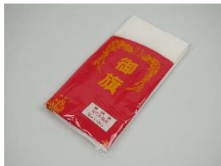
日の丸国旗(天竺綿)